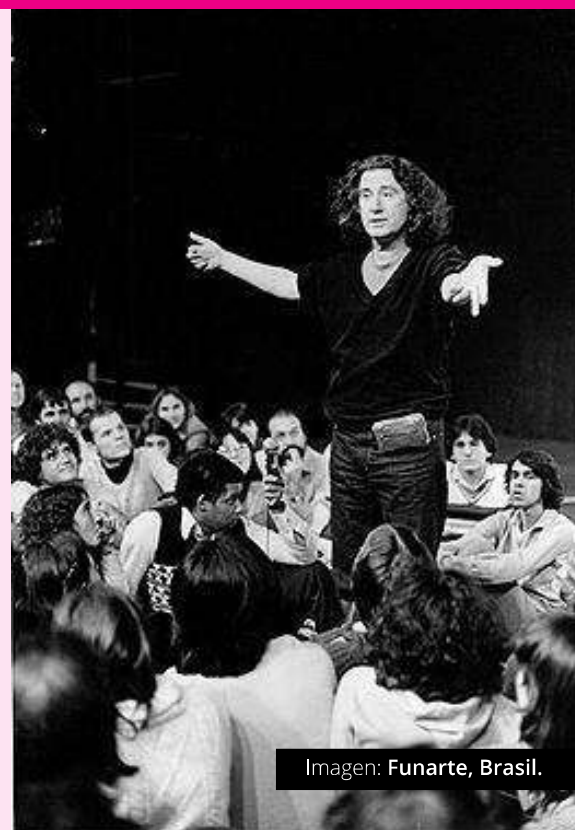
Imagen: Funarte, Brasil.

Ilustración: Wikimedia Commons, Luis Alvaz.